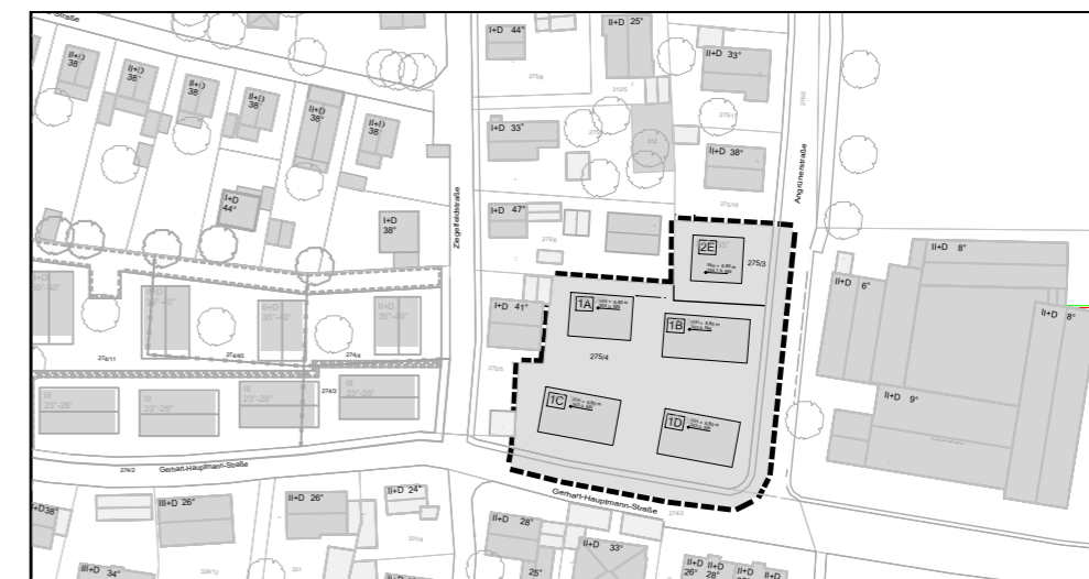
Umgriff M: 1:2.000

Umfassend die Flurstücke mit den Nummern 275/3 und 275/4, sowie die Teilflächen 276/2 (Angrünerstraße) und 274/2 (Gerhart-Hauptmann-Straße).