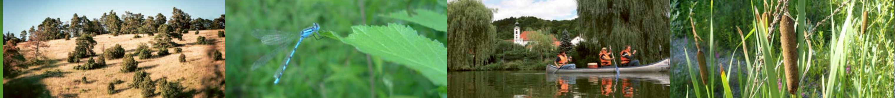
Gungoldinger Wacholderheide | Libelle am Flussufer | Auf der Altmühl bei Eichstätt | Schilf an der Altmühl | Auf Augenhöhe mit den Schwänen

Bootstouren auf der Altmühl bieten die Gelegenheit, einen einzigartigen Naturraum ganz aus der Nähe zu erleben. Rücksichtnahme wird hier mit besonderen Eindrücken belohnt.