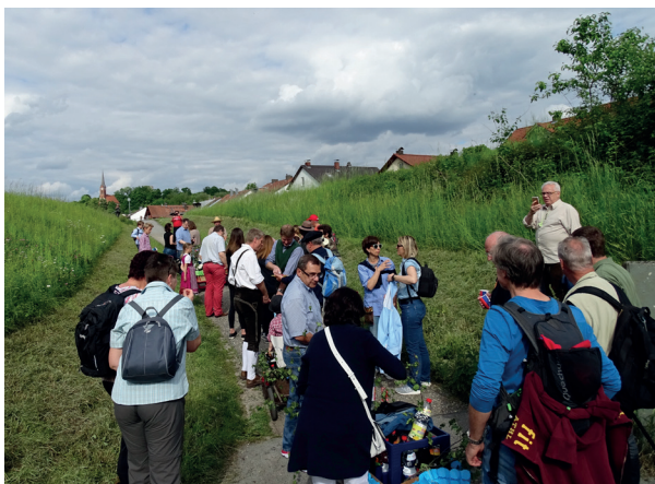
Start zum mittlerweile traditionellen Himmelfahrts-Bollerwagenausflug nach Oberndorf (Bad Abbach) mit Wein, Bier und Gesang

Des Weiteren ist die Städtepartnerschaft in beiden Ländern bei Festen in der Öffentlichkeit durch einen Wein- bzw. Bierstand sichtbar