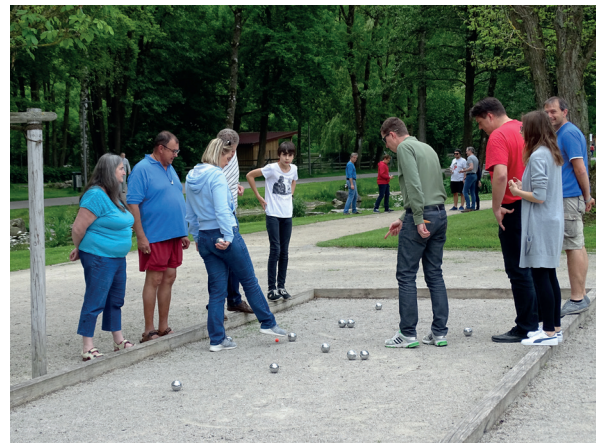
Traditionelles Pétanque-Turnier um den Wanderpokal, hier im Kurpark Bad Abbach