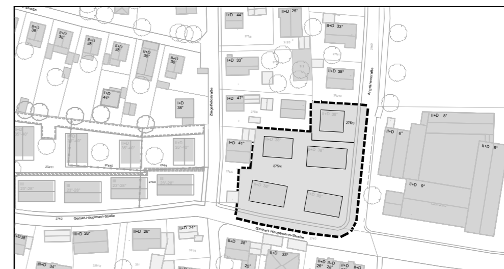
Umgriff M: 1:2.000

Umfassend die Flurstücke mit den Nummern 275/3 und 275/4, sowie die Teilflächen 276/2 (Angrünerstraße) und 274/2 (Gerhart-Hauptmann-Straße).